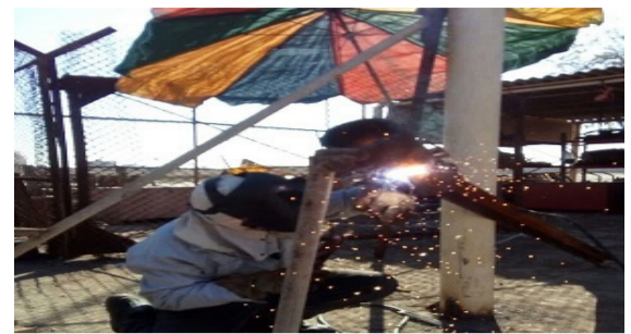
تست دوره ای جوشکاران کد واحد مهندسی نگهداری و تعمیرات خط منطقه خلیج فارس با موفقیت انجام پذیرفت.